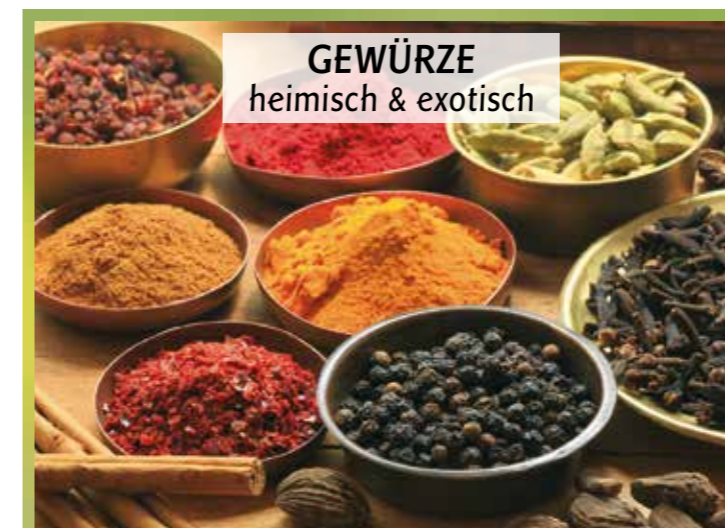
GEWÜRZE heimisch & exotisch

Antworten zu folgenden Fragen finden sich in der FAQ-Rubrik des Internetauftritts des Bundesministeriums des Innern und für Heimat (BMI) ( https://www.bmi.bund.de ).