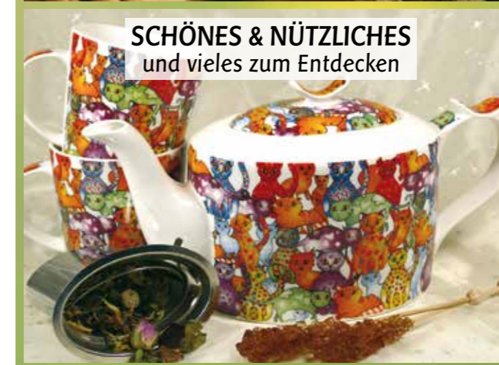
SCHÖNES & NÜTZLICHES und vieles zum Entdecken

Erlesene Gewürze Auswahl bester Tees und viel Schönes zum Verschenken