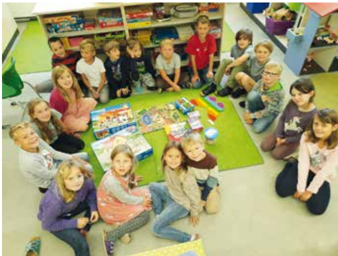
Text/ Foto: Angela Meier

Große Freude bereiten den Kindern in der Mittagsbetreuung die vielen gespendeten Spielsachen vom Kleidermarkt-Team. Vielen, vielen herzlichen Dank dafür!