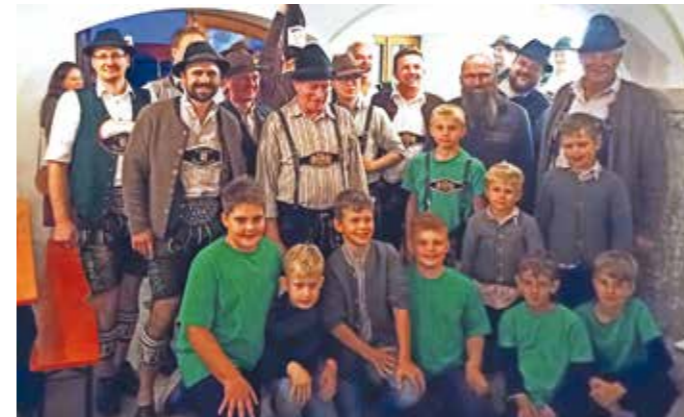
Siegerfoto der drei Erstplatzierten: 1. vorn bzw. kniend Buam (Gruppe Michael), 2. Jugendmannschaft (Gruppe Alex) und 3. gemischte Gruppe der Goaßlschnoizer.

Und diese beiden trugen dann das spannende Finale aus und es gewannen die Buam vom Trachtenverein (Gruppe Michael) gegen die Jugendmannschaft Trachtenverein „Alex“ mit 4 : 2 und ihr Jubel kannte keine Grenzen! Dritte wurde die gemischte Gruppe der Goaßlschnoizer, die erst bei der siebten Kehre den Sieger ermittelten (gegen die Gruppe Trachtenverein „Wastl“). Sehr gut haben sich auch die Mädls vom Trachtenverein als 5. geschlagen; sechste wurden dann unsere Röckefrauen, vor den punktgleichen gemischten Gruppen Trachtenverein „Franziska“ und Trachtenverein „Leo“.