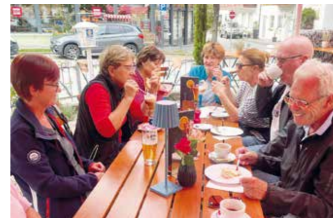
Weiter ging es im großen Bogen über Schalldorf der Kaffee-Rast in Rott am Inn (Foto) entgegen.