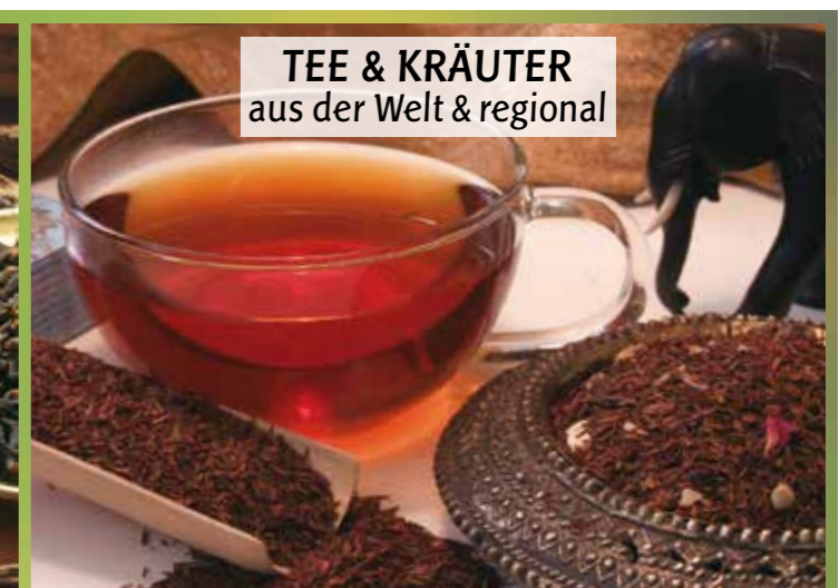
TEE & KRÄUTER aus der Welt & regional