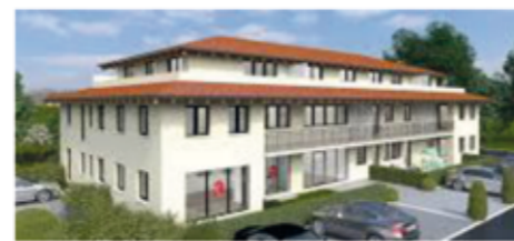
Alpenstraße 25 - 08039 909 63 70 - alpen-apo@web.de

Wir sind für Sie vor Ort da und beraten Sie dazu gerne! Ihr Team der Alpen Apotheke