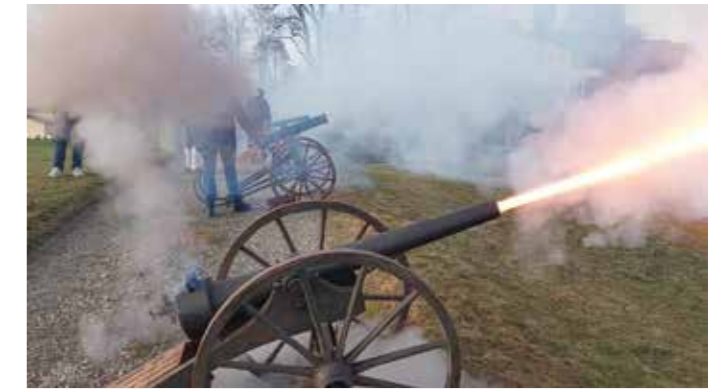
Silvesterschießen in Haag- die Griesstätter Kanone beim Schuss

Ebenfalls bei heiterem Wetter konnte am Silvesterschießen in Haag auf der "Freistatt" teilgenommen werden. Ein besonders Erlebnis waren die Schüsse der Salutkanonen, zu deren schwersten die Griesstätter Kanone gehörte. Die Schützen renovierten vor etlichen Jahren die alte gemeindeeigene Kanone, die zu einem Schmuckstück wurde, um das Griesstätt beneidet wird.