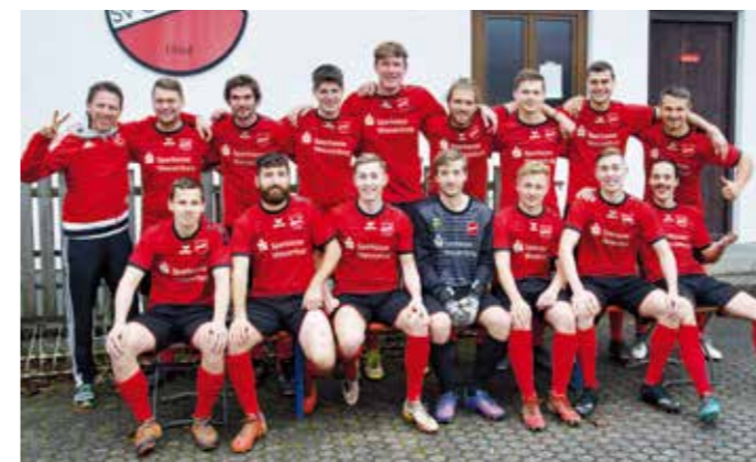
Die 1. Herren-Mannschaft des DJK im neuen Trikot.

Abschluss der Vorrunde im November konnten im neuen glänzenden Rot die ersten Punkte geholt werden. Die Abteilung Fußball bedankte sich bei Julian Schuster und der Sparkasse Wasserburg. Text/ Foto: Florian Spötzl