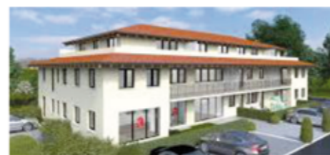
Alpenstraße 25 - 08039 909 63 70 - alpen-apo@web.de

Einen guten Start ins neue Jahr 2023 wünscht Ihnen das Team der Alpenapotheke!