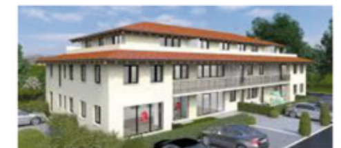
Alpenstraße 25, Tel: 08039 - 90 96 370, alpen-apo@web.de

Wir sind für Sie vor Ort! Ihr Team der Alpen Apotheke