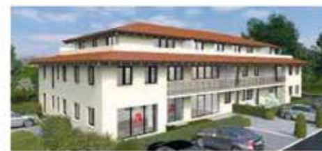
Alpenstraße 25 - 08039 909 63 70 - alpen-apo@web.de