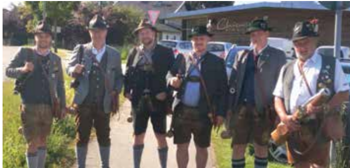
Die gemischte Gruppe Griesstätter und Breitbrunner Böllerschützen beim Feuerwehrfest in Breitbrunn.