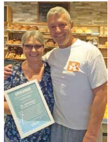
Text: Red.